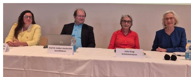
Abb. 1: Vorstand der GEV bei der Mitgliederversammlung am 16.05.2025