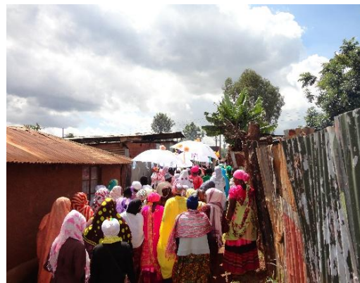
Abb. 7: "Ortsnamen, Zugehörigkeit, Heimat – Kenianische Nubi und ihr homeland Kibera" Dr* Joh Sarre, Freiburg

Insbesondere die Vorträge, die sich mit Klima und Umwelt befassen, werden zunehmend von Schulklassen aus Stuttgart und dem Umland besucht. Der Verband Deutscher Schulgeographie e.V. Baden-Württemberg unterstützt uns bei der Verbreitung unseres Programms.