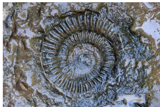
Abb.11: Opferdinger Schneckensplaster