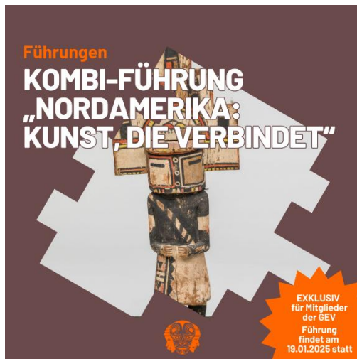
Abb. 4: Kombiführung Nord-Amerika

Bei der Nachwuchsförderung konzentrieren wir uns seit einigen Jahren auf zwei Schwerpunkte. Zum einen verleihen wir den Geographie-Preis an besonders erfolgreiche Abiturientinnen und Abiturienten im Leistungsfach Geographie. Jedes Gymnasium in Baden-Württemberg kann den besten oder die beste Abiturientin melden. Alle erhalten den Geographie-Preis und die fünf Besten werden dann noch mit dem Geographie-Sonderpreis ausgezeichnet. Zum anderen fördern wir wissenschaftlichen Nachwuchs durch die Ausschreibung "Junge Forschung – Mensch, Kultur, Umwelt". Diese jährliche Ausschreibung hat zum Ziel, die GEV-Vorträge interdisziplinärer zu gestalten, auch ein jüngeres Publikum anzusprechen und Nachwuchswissenschaftlerinnen und -wissenschaftler als Vortragende zu gewinnen. Die Arbeitsgruppe "Junge Forschung" bereitet hierfür jährlich eine Ausschreibung vor, bei der sich Interessierte für einen Vortrag bewerben können. Die Ausschreibung wird an über 250 Forschungseinrichtungen, Universitäten, Museen und andere Organisationen in Deutschland verteilt. Aus den Bewerbungen wählt die Jury die zwei Favoriten aus. Alle