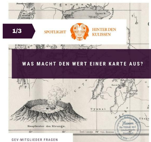
Abb. 2: Spotlight-Post "Historische Landkarten der Universität Tübingen", Folge 3

Im Projekt "Spotlight - Hinter den Kulissen" werden Fragen von GEV-Mitgliedern zum Verein, zu Förderprojekten und zu Ausstellungen des Linden-Museums gesammelt und von Expertinnen und Experten beantwortet. Im Jahr 2025 lief von Januar bis April die Fortsetzung der Reihe "Historische Landkarten der Universität Tübingen", von Mai bis Oktober die Reihe "Restaurierung – Zugänglichkeit langfristig bewahren" und von Oktober bis Dezember die Reihe "Celebrating Womanhood. Kulturerbe vom Kilimandscharo" als Begleitung der gleichlautenden Ausstellung im Linden-Museum.