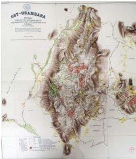
Abb. 13: Historische Landkarte Ost-Usambara, Universität Tübingen

Seit Ende 2025 können die wertvollen historischen Karten im neuen Sammlungszentrum der Universität Tübingen unter optimalen Bedingungen gelagert werden. Über den Link zum eMuseum sind die digitalisierten Karten auch einem breiten Publikum leicht zugänglich: https://www.emuseum.uni-tuebingen.de/groups/geographische-karten .