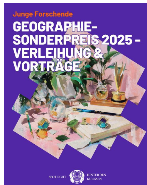
Abb. 5: Einladung zur Preisverleihung Geographie-Sonderpreis 2025 und Junge Forschung 2025

Die Möglichkeit zum Gespräch und Umtrunk wird von den Mitgliedern immer wieder nachgefragt. Wir werden dies auch künftig für einzelne Veranstaltungen fortführen.