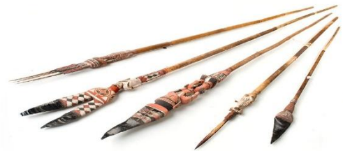
Abb.10: Speere in der Südseesammlung, Obergünzburg

Am 22.03. führte eine Tagesexkursion zur Südsee-Sammlung des Obergünzburger Kapitäns Karl Nauer, der sich von 1903 bis 1913 in Ozeanien aufhielt. Auf dem Weg dorthin besichtigten die Teilnehmenden die grandiose Basilika in Ottobeuren.