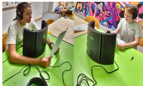
Abb.12: Jugendliche beim Podcast-Workshop

Die Ergebnisse werden nach einer Nachbearbeitung auf dem Media-Guide des Linden-Museums als zusätzliches Angebot zur Verfügung stehen.